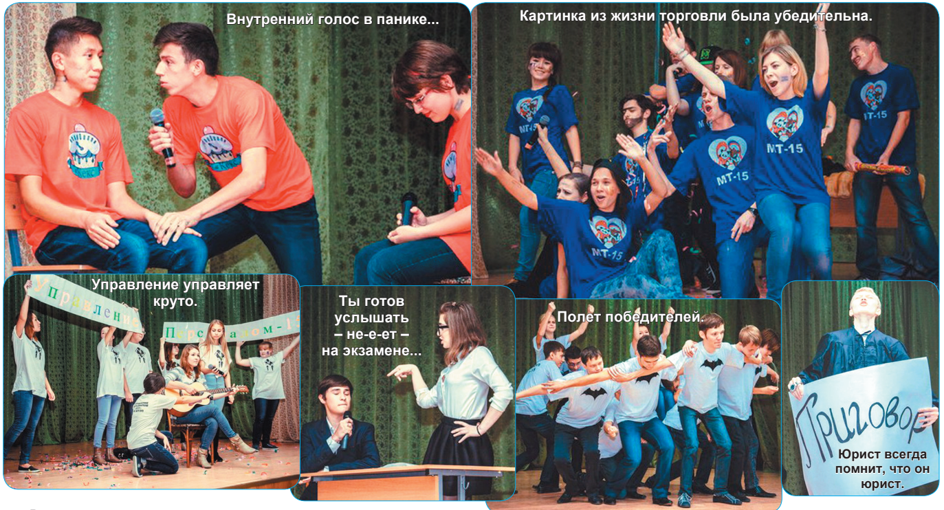
Внутренний голос в панике...