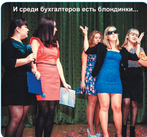
И среди бухгалтеров есть блондинки...

поход в кафе, так как там все было душевно и весело.