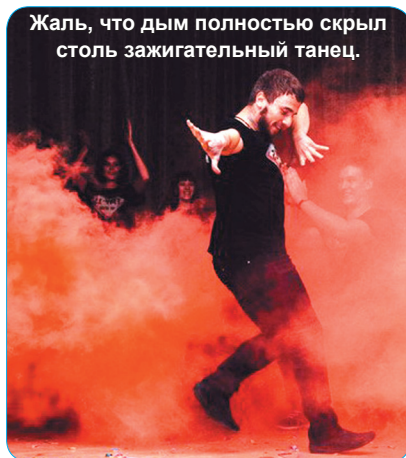
Жаль, что дым полностью скрыл столь зажигательный танец.