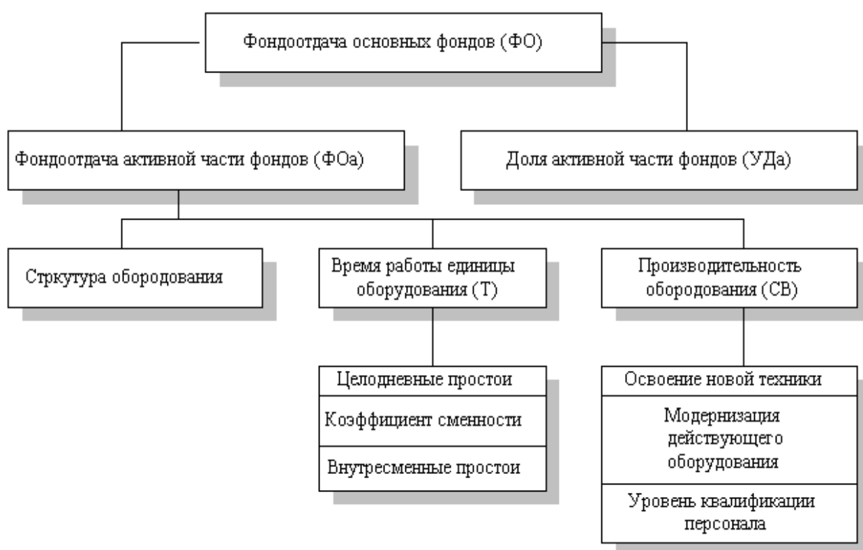
Рисунок 2 – Схема факторной модели фондоотдачи

Рисунки нумеруются арабскими цифрами в пределах разделов. Номер иллюстрации состоит из номера раздела и порядкового номера иллюстрации, разделенных точкой, (например: Рисунок 1.1 – Динамика инвестиций за 2015-2018 гг., руб.). Можно использовать сквозную нумерацию по всей работе.