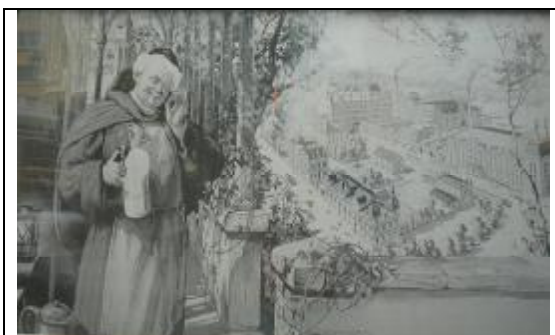
«Монахи варят пиво», экспозиция в музее истории пива, Циндао, 2010 г.

— Международный фестиваль пива. За последние годы фестиваль стал крупнейшим в Азии и приобрел большую популярность во всем мире. Во время этого фестиваля крупные производители из многих стран мира представляют свою продукцию на специально оборудованных стендах. В программе — карнавальные