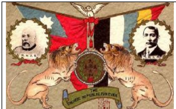
Плакат в честь провозглашения Китайской республики с портретами Юань Шикая и Сунь Ятсена

открыт для службы. С мая 1999 г. стал туристическим объектом с категорией ААА (рекомендуемые к посещению объекты национального наследия).