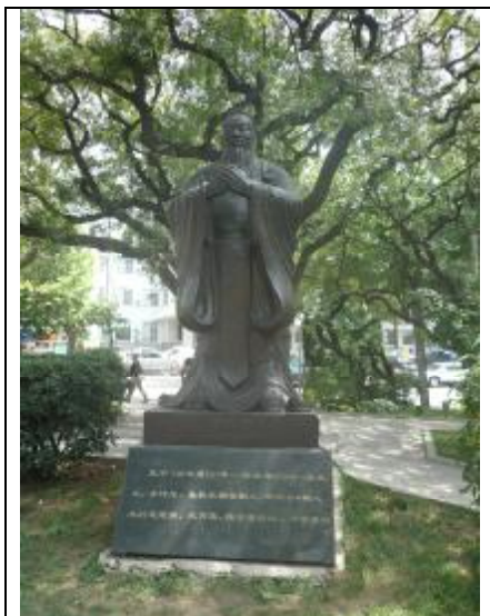
Памятник Конфуцию, 2010 г.

Первый в новой династии Хань (после императора Цинь Шихуана) император Уди, отличался не только большим количеством амбиций, но и несомненными талантами. Он принёс ритуальные жертвы на горе Буцзи рядом с современным Циндао и распорядился выстроить несколько храмов. Одной из наиболее значимых реформ, имевшей да-