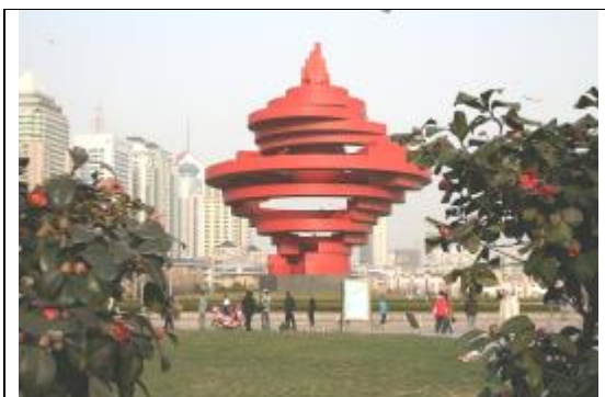
Памятник событиям 4 мая 2010 г.

только 44 дня (с 25 сентября по 8 ноября) пришлось на непосредственные бои под Циндао. Причинами столь недолгого сопротивления укрепленной крепости явились не только умелые действия японских офицеров и солдат (высадка и развертывание японского осадного корпуса велась очень медленными темпами), но и отсутствие