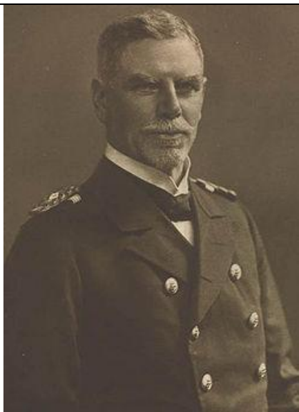
Максимилиан Йоханесс фон Шпее

Шпее ушла из порта в начале войны, чтобы дойти до Германии и избежать опасности ее блокирования в гавани военно-морскими силами Антанты. В порту оставались австрийский крейсер «Кайзерин Элизабет» и еще несколько кораблей. С суши Циндао защищала двойная линия обороны, а с моря — береговые батареи. Так или иначе, крепость была рассчитана на отражение атаки британского или французского экспедиционного корпуса, но не на войну против близко расположенной Японии.