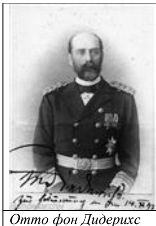
Отто фон Дидерихс

Позже этот командующий отмечает: «Я полагаю, что варвары-немцы уже давно зарятся на провинцию Шаньдун. Они разослали своих миссионеров во многие уезды под предлогом проповеди религии, а на самом деле для разведки местности. Именно в этом кроется причина