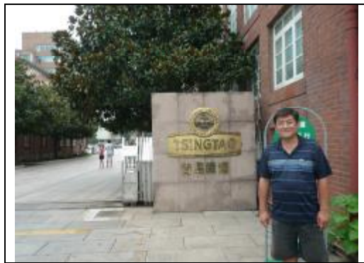
Вход на пивной завод Tsingtao, 2010 г.

Во время концессии был построен и пивоваренный завод, функционирующий сегодня и производящий 12% всего китайского пива. Официальной датой