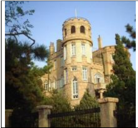
Резиденция губернатора, 1903 г.

На южных склонах горы Циндао в 1903 г. была построена резиденция немецкого правительства, стилизованная под замок XVIII в. При этом видно следование классическим архитектурным стилям романского и готического направления с использованием модного в начале XX в. направления «модерн». Сегодня эта территория объединена в район «Немецкой концессии» и охраняется как памятники архитектуры. К чести города, работа ведется на очень высоком уровне, налицо действительно бережное отношение не только к отдельным объектам, но и к облику района в целом. Многие города современного Китая не могут похвастать сохранным историческим обликом — многомиллионные мегаполисы поглощают «островки истории», оставляя разрозненные объекты. В частности, эта тенденция присуща Харбину, где богатое русское наследие времен купеческой