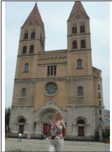
Собор Св.Михаила, 2010 г.

В 1934 г. в Циндао был построен немецкий католический собор Св.Михаила в классическом готическом стиле. Сегодня он действует, и на службу приходят католики со всего города. Собор находится на улице Чжэцзян, раньше назывался Собором святого Миарра. Построен он главным образом из желтого мрамора, плиты украшены крестом. Высота основного здания 80 м, занимает 2470 м 2 по площади. По обеим сторонам главного входа возвышаются колокольные башни высотой 56 м. По причине необычности зодчества собор сегодня является основной достопримечательностью Циндао.