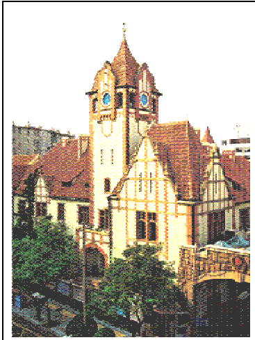
Здание полиции, 1904 г.

возникновения вражды. Ныне в связи с постройкой железнодорожной