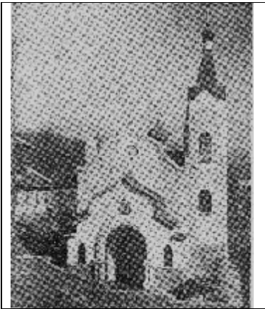
Свято-Софийская церковь, Циндао, 1928 г.