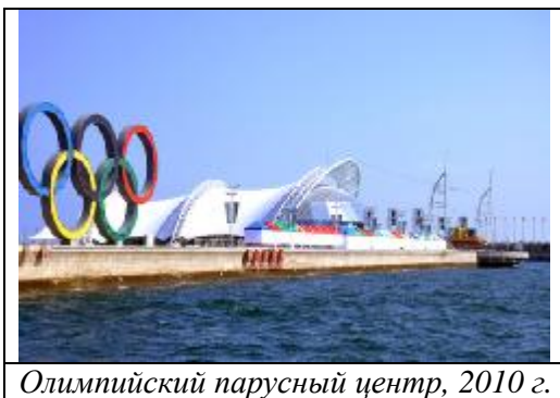
Олимпийский парусный центр, 2010 г.

С целью привлечь инвестиции и победить в соперничестве с другими китайскими городами Циндао позиционировал и позиционирует себя как «Город парусного спорта». В 2008 г. здесь проводилась Олимпийская парусная регата, и город не собирается останавливаться на достигнутом.