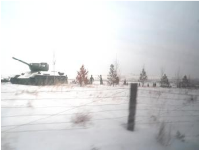
Восстановленные позиции армии при наступлении

Операцию предстояло проводить против очень сильной группировки противника, насчитывавшей свыше 1 млн. человек и имевшей, 6260 орудий и минометов, 1150 танков, 1500 самолетов.