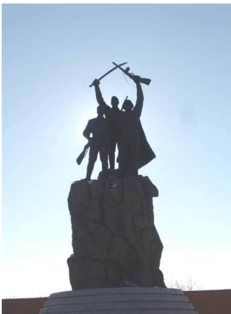
Памятник воинам трех братских народов

ское командование реально оценивало стратегическое значение объекта, формируя завесу секретности на инженерные решения и планы строительства катакомб. В результате, начиная с 1935 г., десятки тысяч китайских рабочих из числа местных жителей, а также других привлеченных на строительство, были уничтожены посредством массовых расстрелов на северном берегу реки Хайлар. По рассказам очевидцев, многие японские инженеры и надсмотрщики уже после возвращения в Японию также пропали без вести, что являлось дополнительным свидетельством высокого уровня важности объекта.