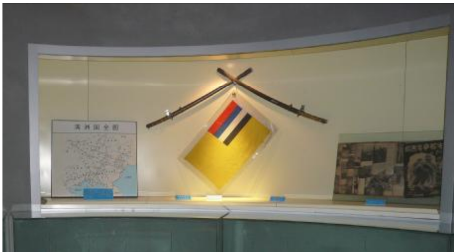
Символика Маньчжоу Го в период оккупации

Первый зал посвящен истории создания Освободительной армии Китая и совместной российско-китайской подпольной борьбе с японскими оккупантами.