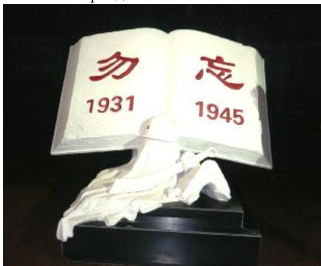
Книга памяти на входе в музей

В начале этого года, совершенно неожиданно, мне довелось побывать в Парке памяти мировой антифашистской войны района Хайлара, демонстрирующем единение трех народов — китайского, монгольского и русского в борьбе с милитаристской Японией в период 1931–1945 гг.