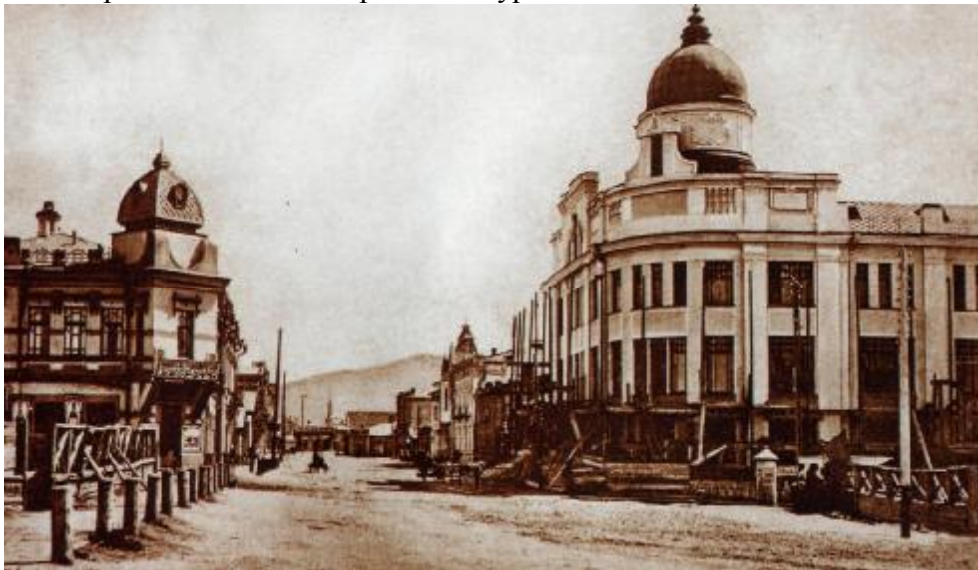
Комплекс из двух домов и помещений хозяйственного назначения, по-

По данным В. Немерова, Борису Леонтьевичу Зазовскому принадлежало все строение, так как построено оно было по его заказу городским архитектором Ф.Е.Пономаревым: «Как и большинство других жилых строений, спроектированных Ф.Е. Пономаревым, дом Зазовского имел форму усеченного прямого угла с широкими арочными окнами, фигурным обрамлением балюстрады и ажурными балконами». 7