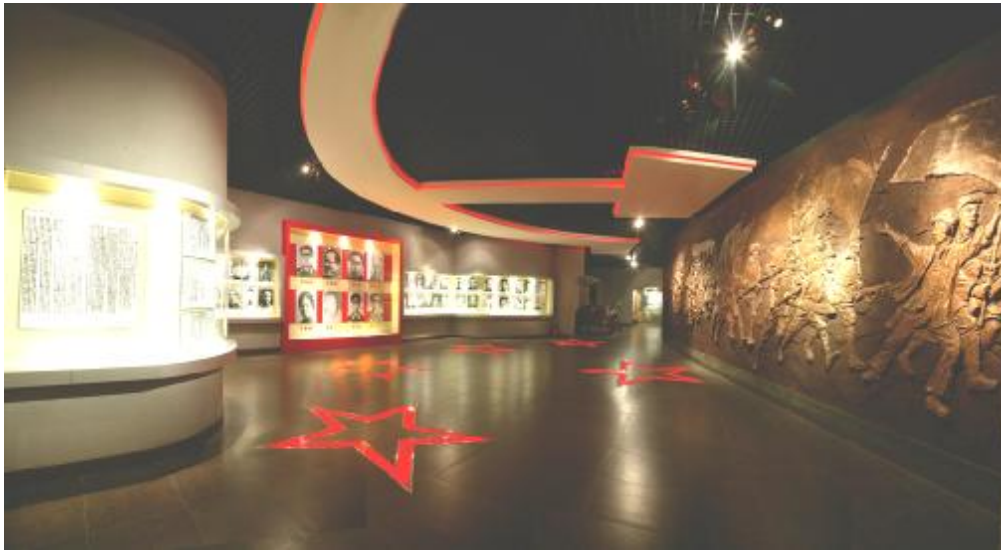
Зал освободительного движения

Наземная часть парка представлена командным пунктом (ставкой) японцев, восстановленными линиями окопов и траншей, наглядно представляющими позиции войск на момент военных действий. Полностью восстановлены позиции артиллерии и воспроизведено 55 копий танков, расположенных в соответствии с рассказами очевидцев на позициях их реального расположения на момент атаки.