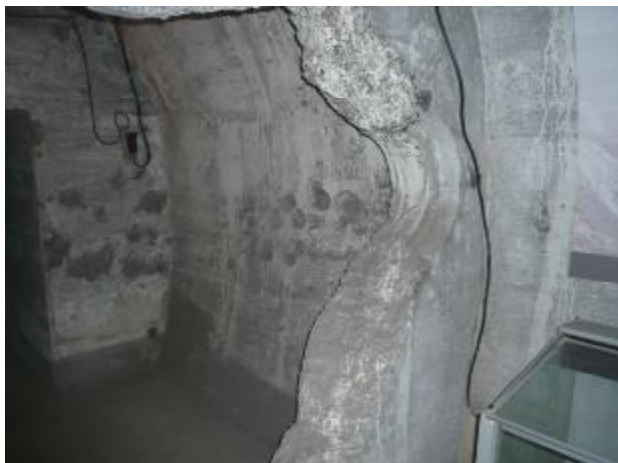
Часть стены катакомб со следами артиллерийских орудий

Результаты Маньчжурской операции впечатляют. Во-первых, войска Забайкальского, 1-го и 2-го Дальневосточных фронтов при содействии сил Тихоокеанского флота и Амурской военной флотилии с участием монгольских соединений в короткие сроки разгромили самую сильную группировку войск Японии — Квантунскую армию, освободили Маньчжурию, Северо-Восточный Китай, северную часть Кореи, Южный Сахалин и Курильские острова. Во-вторых, разгром Квантунской армии и потеря военно-экономических баз в Китае и Корее лишили Японию реальных сил и возможностей продолжать войну. В-третьих, Россия смыла позор поражения в русско-японской войне 1904–05 гг., тяжелой памятью лежавший в сознании народа нашей страны.