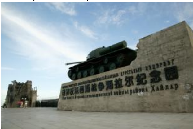
Центральный вход на территорию парка

Парк находится в Хайларе, к северу от города. Занимает географически и стратегически очень важное место, так как большая его часть расположена на горах, окружающих город. Среди имеющихся памятных сооружений в Китае, состоящих из наземной и подземной частей, этот парк является сегодня самым большим и наиболее сложным в своей подземной части сооружением. Парк полностью оснащен современным мультимедийным оборудованием и является наиболее сохранившимся из всех объектов наследия далекого военного времени. Это единственный в Китае парк, где с акцентом на многонациональное содружество воспеваются патриотизм, героизм и интернационализм. Сооружения парка полноценно демонстрируют проходившие в 1945 г. боевые действия и пятнадцатилетнее антифашистское движение трех народов — китайского, русского и монгольского. Основным девизом является так хорошо знакомый, но забытый в последнее время лозунг — «Мир во всем мире».