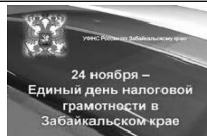
РЫЧКОВА Надежда Ф-08-2

Проходя практику в налоговой инспекции, мы более углубленно изучили все налоги и их поступление в местный бюджет, механизм их исчисления и сроки их уплаты.