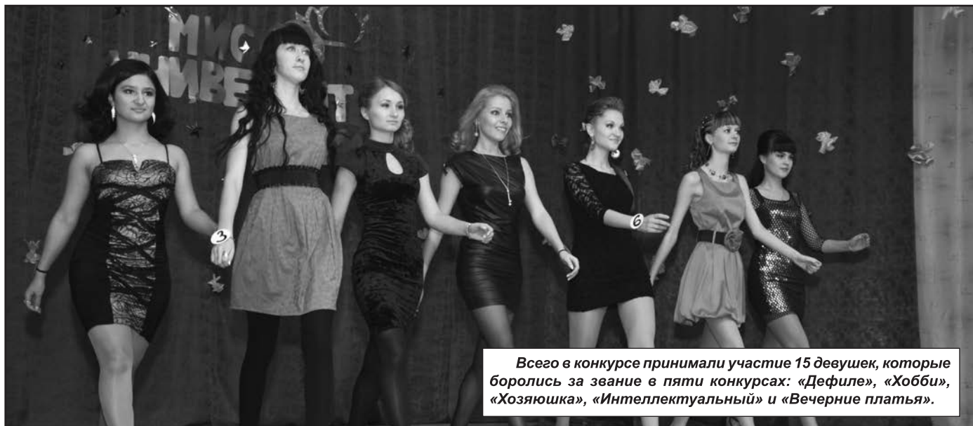
Всего в конкурсе принимали участие 15 девушек, которые боролись за звание в пяти конкурсах: «Дефиле», «Хобби», «Хозяюшка», «Интеллектуальный» и «Вечерние платья».