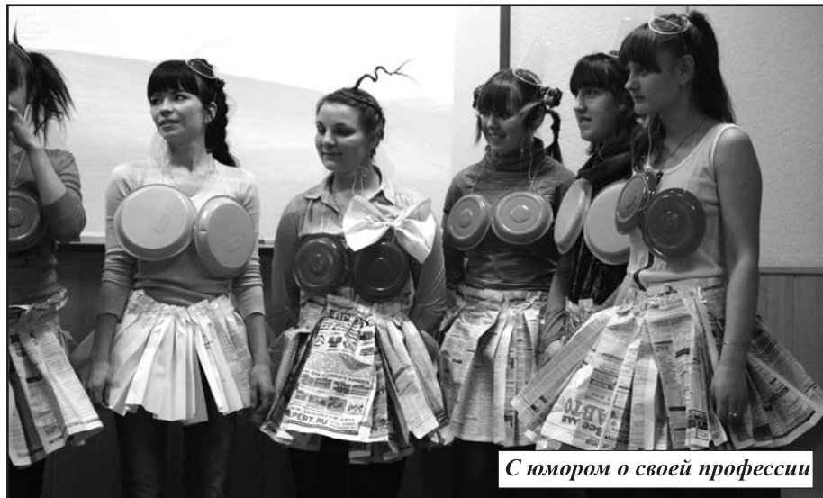
С юмором о своей профессии